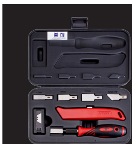
Falçata - Raspa Seti - 7 Parça | Art.-Nr. 0715 66 40