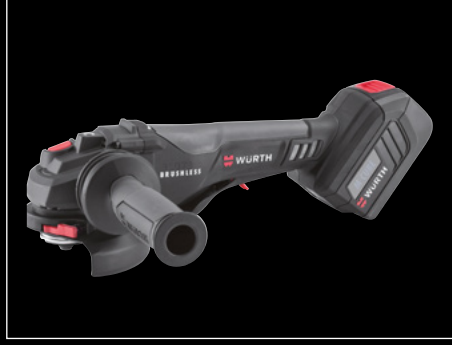
AKÜLÜ AVUÇ İÇİ TAŞLAMA MAKİNESİ AWS 18-125 P COMPACT M-CUBE®