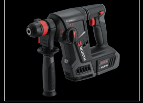
AKÜLÜ DARBELİ MATKAP ABH 18 COMPACT M-CUBE®