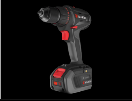
AKÜLÜ VIDALAMA MAKİNESİ ABS 18 COMPACT M-CUBE®

Günlük kullanım için kullanışlı ÜÇLÜ SET 18 V M-CUBE®